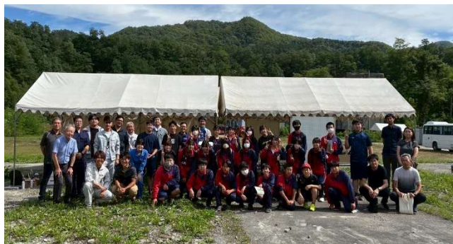
図 三笠中学校課外体験学習